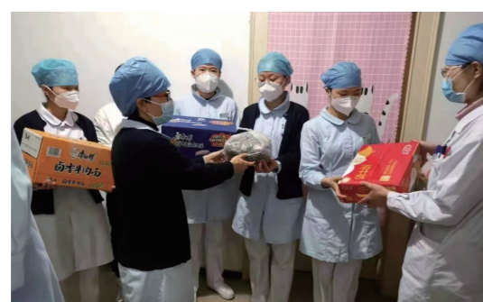
科室进行了走访慰问。

近日，北京四季青医院工会开展节前走访慰问活动。院党委、工会高度重视，精心准备节日慰问品，班子成员分头带领职能科室人员来到临床、医技、后勤科室及下属社区卫生服务站等63个