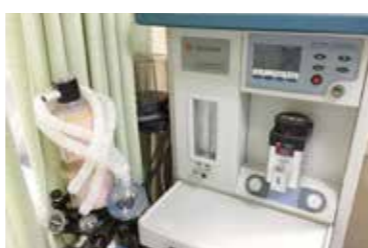
范,严格执行一次性器械使用的有关规定。

北京四季青医院胃肠镜室现有奥林巴斯最高端配置的290主机,胃镜、肠镜数条以及高频电刀治疗仪,胃肠镜的检查、治疗操作及器械的清洗消毒严格遵守操作规